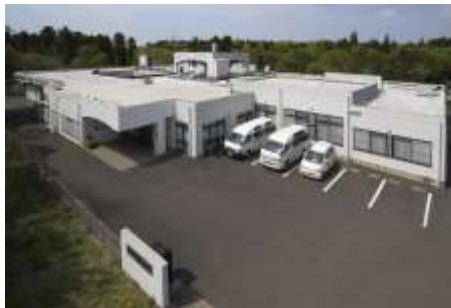
千葉エリア (ちば美香苑) 043-228-3848 (最寄駅) 鎌取 駅から送迎有り