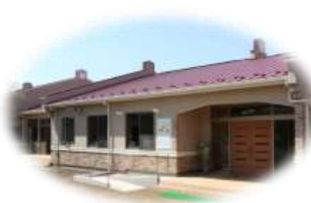
ブレーメン実花こども園 047-477-4141 (最寄駅) 実籾 駅