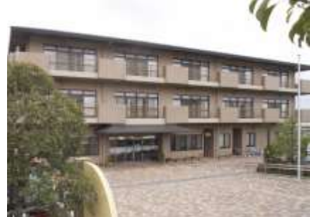
船橋エリア (朋松苑) 047-410-0117 (最寄駅) 海神 駅 または 東海神駅