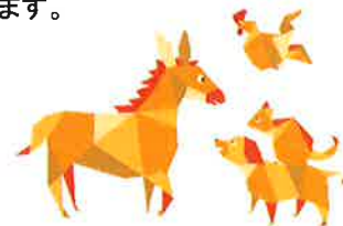
プレーメン実花こども園 社会福祉法人八千代美香会