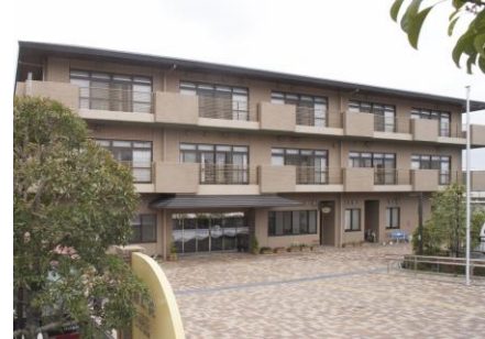
船橋エリア (朋松苑) 047-410-0117 (最寄駅) 海神 駅 または 東海神駅