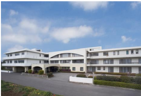
八千代エリア (美香苑) 047-482-8670 (最寄駅) 勝田台 駅からバス15分