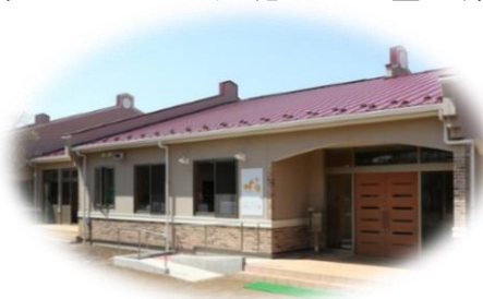
プレーメン実花こども園 047-477-4141 (最寄駅) 実籾 駅