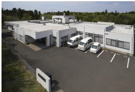
千葉エリア (ちば美香苑) 043-228-3848 (最寄駅) 鎌取 駅から送迎有り